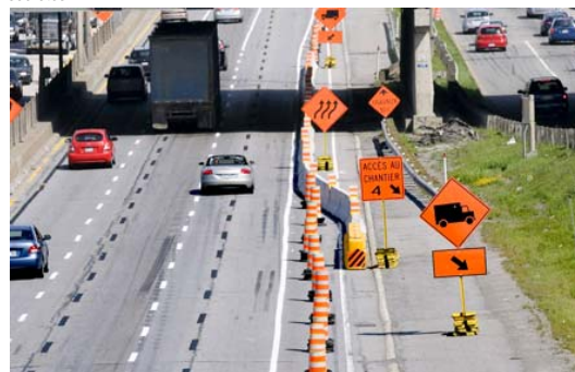
Un des intervenants du milieu estime que les travaux publics coûtent jusqu'à 35 % plus cher à cause de ces ententes secrètes.

Cette pratique serait généralisée dans les travaux routiers, selon plusieurs témoignages recueillis par les journalistes. Et la mafia italienne montréalaise serait là pour surveiller que personne ne vienne fausser les règles du groupe d'entrepreneurs qui se séparent les contrats. Un des intervenants du milieu estime que les travaux publics coûtent jusqu'à 35 % plus cher à cause de ces ententes secrètes.